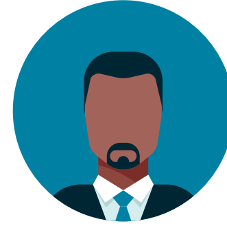
且我们还有新设立的C级高管岗位，CTO（首席转型官）。