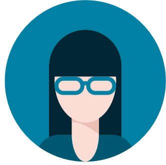
首席执行官CEO很常见